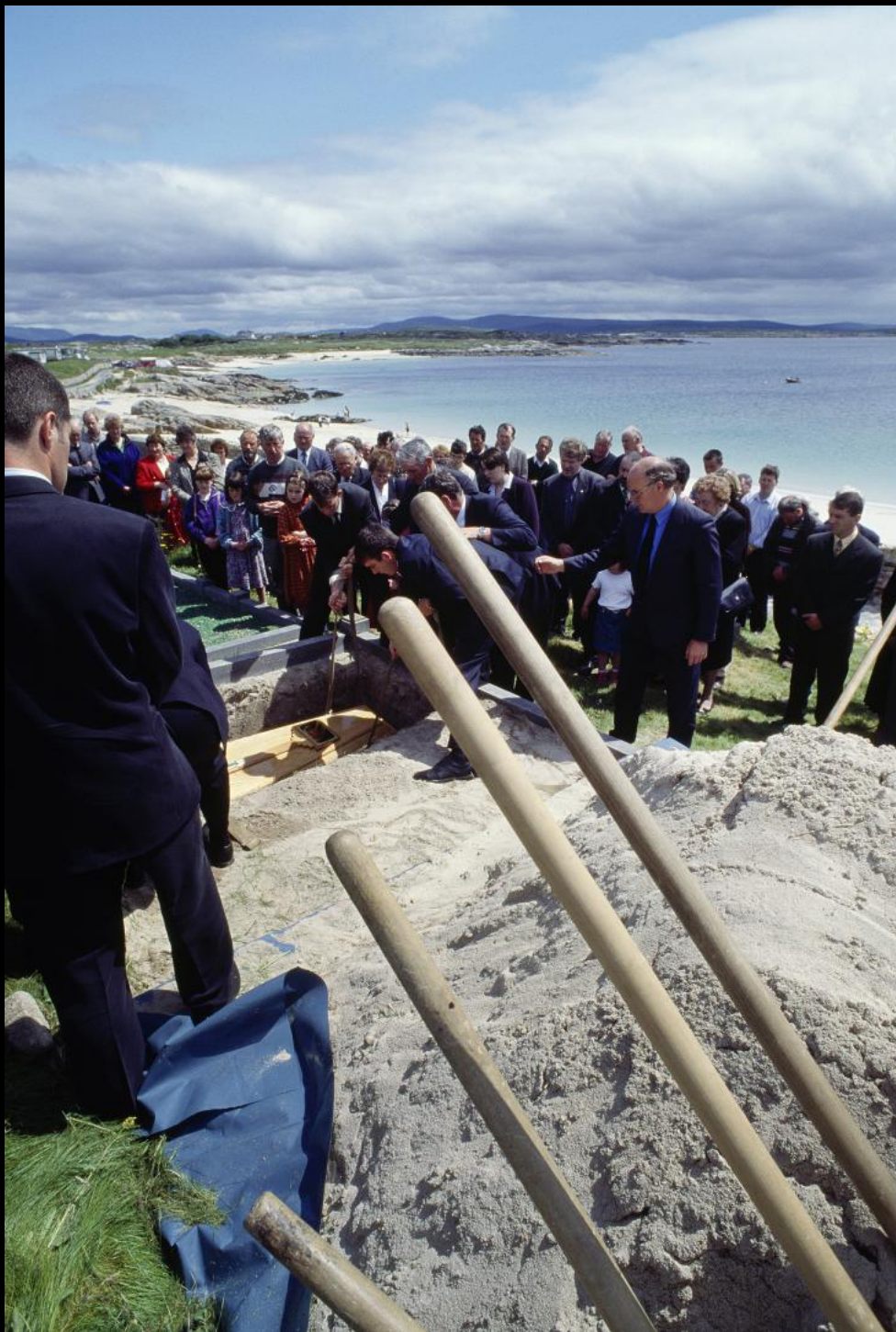
offenes Grab bei einem Begräbnis in Roundstone