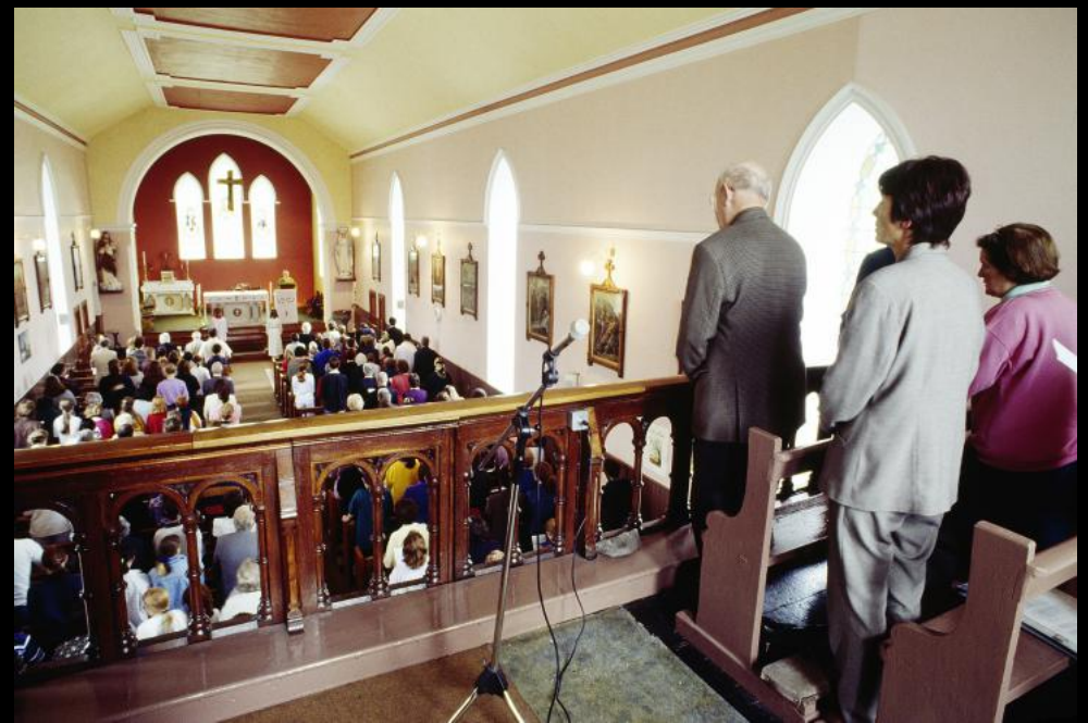
Gottesdienst in Roundstone