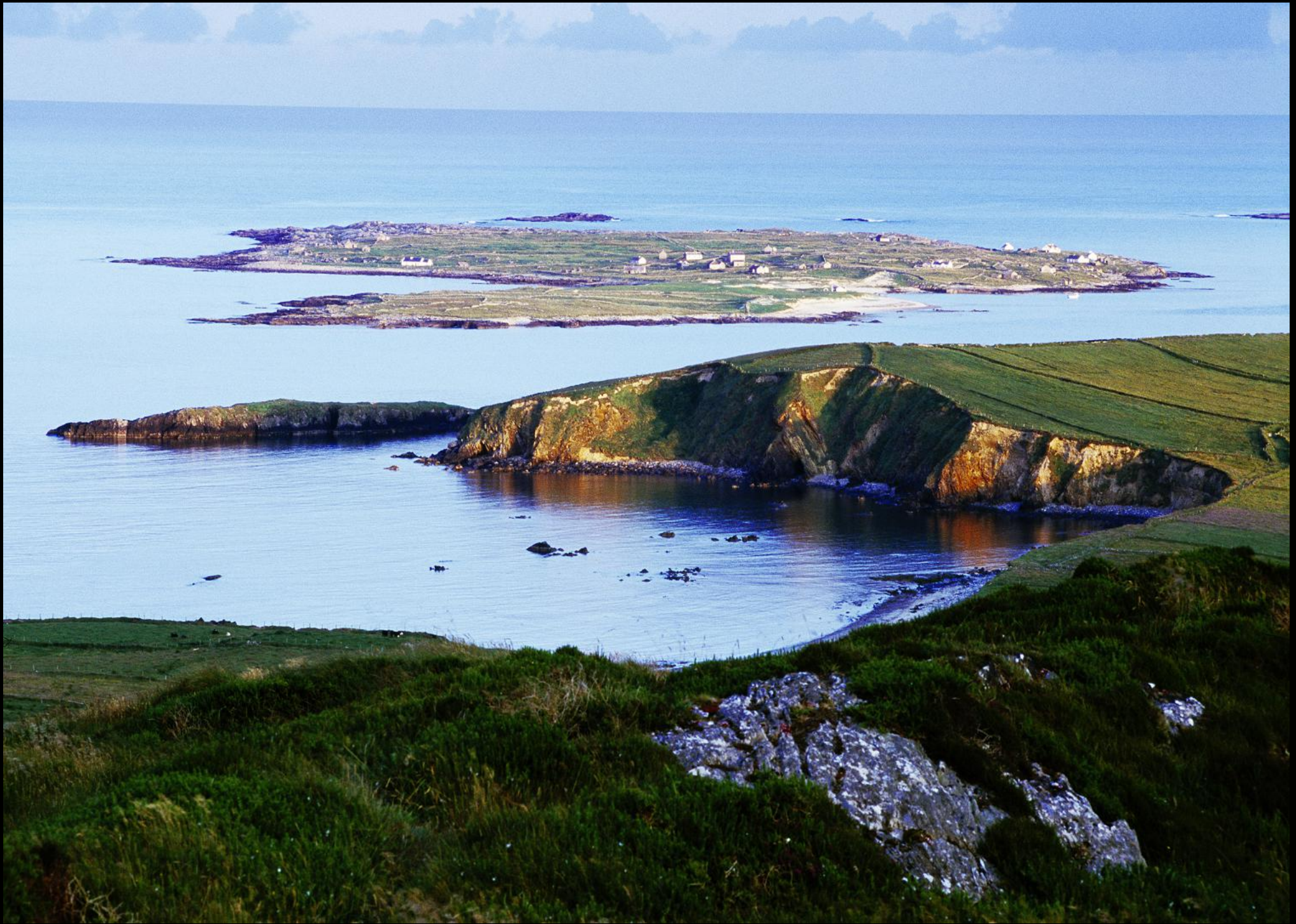
Blick von der Panoramastrasse "Sky Road" zum Atlantik