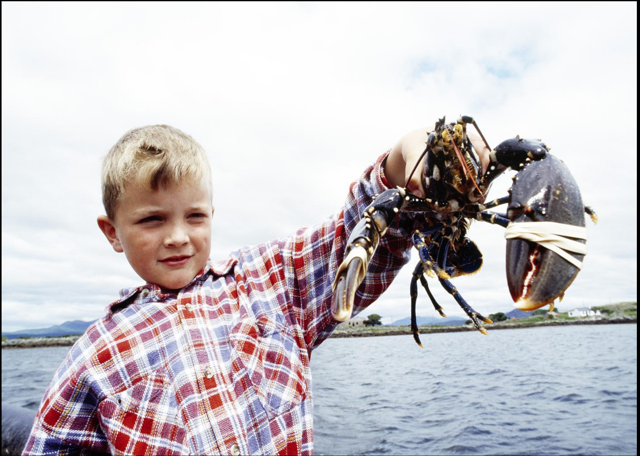
Bub mit Hummer