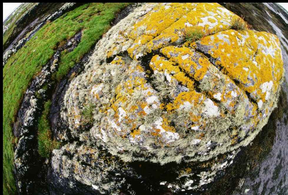
mit gelben Flechten bewachsener Stein