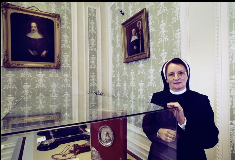
"Kylemore Abbey": Benediktiner Nonne im Stifts-Museum