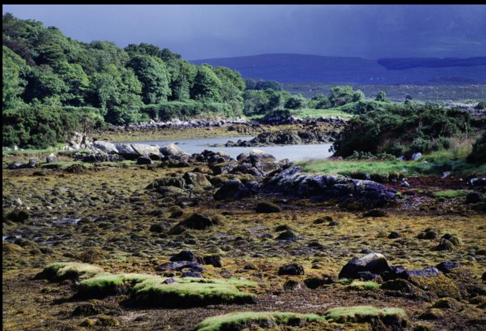
Archipelago an der "Sky Road"