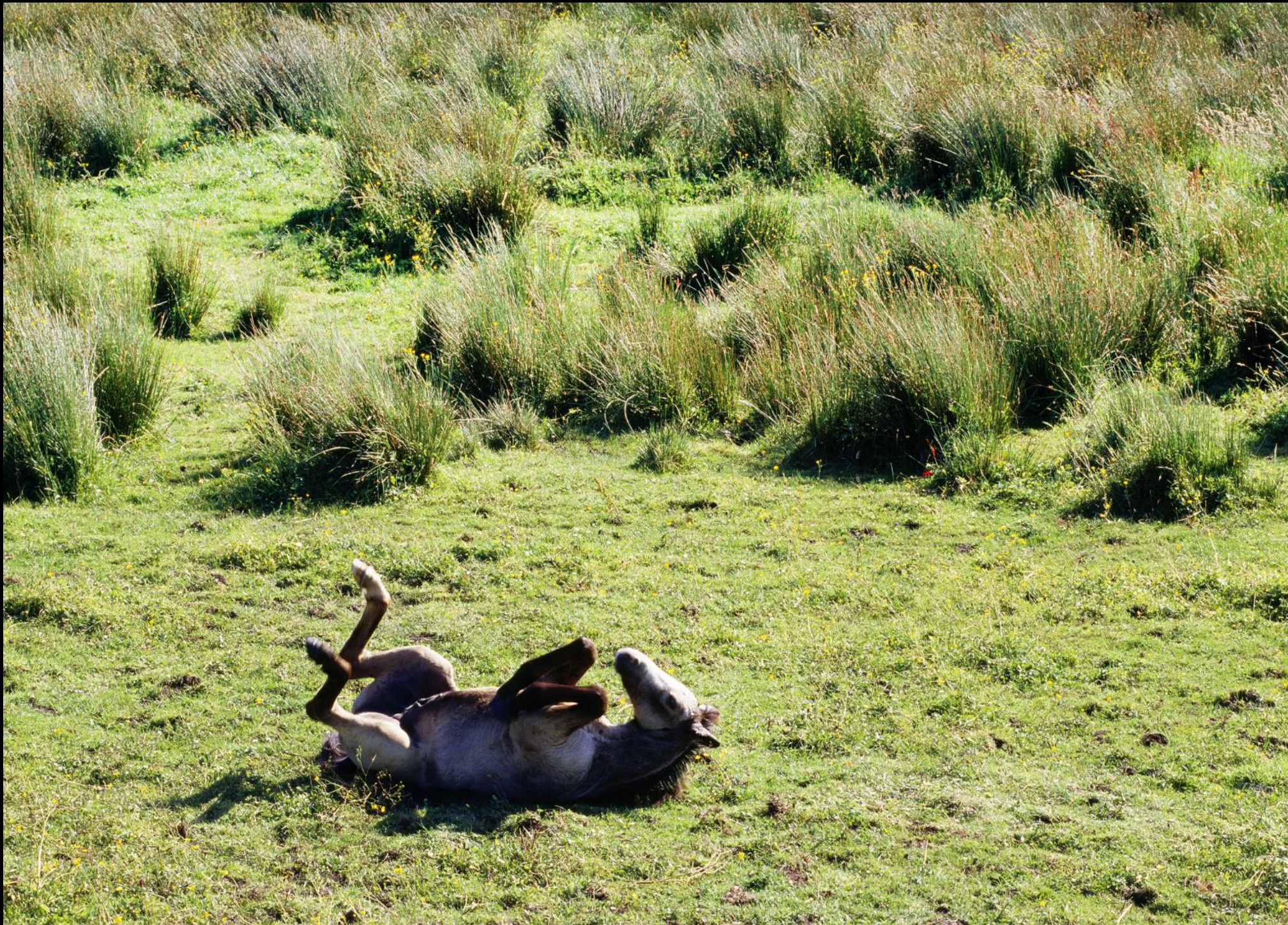
Pferd wälzt sich genüsslich auf der Weide