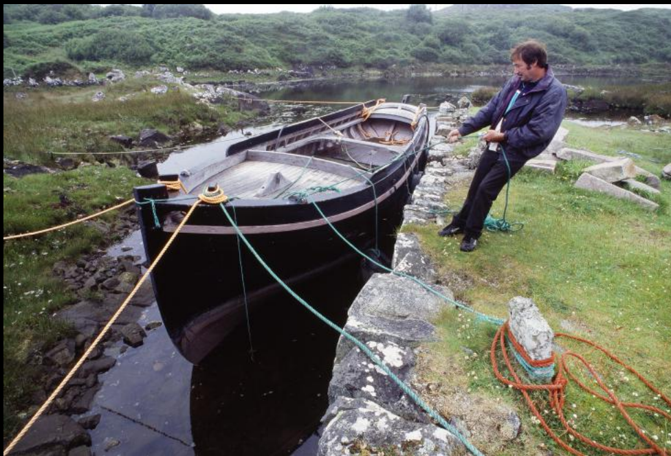
Mann beim Verzurren des Bootes in einem kleinen Kanal bei Clifden