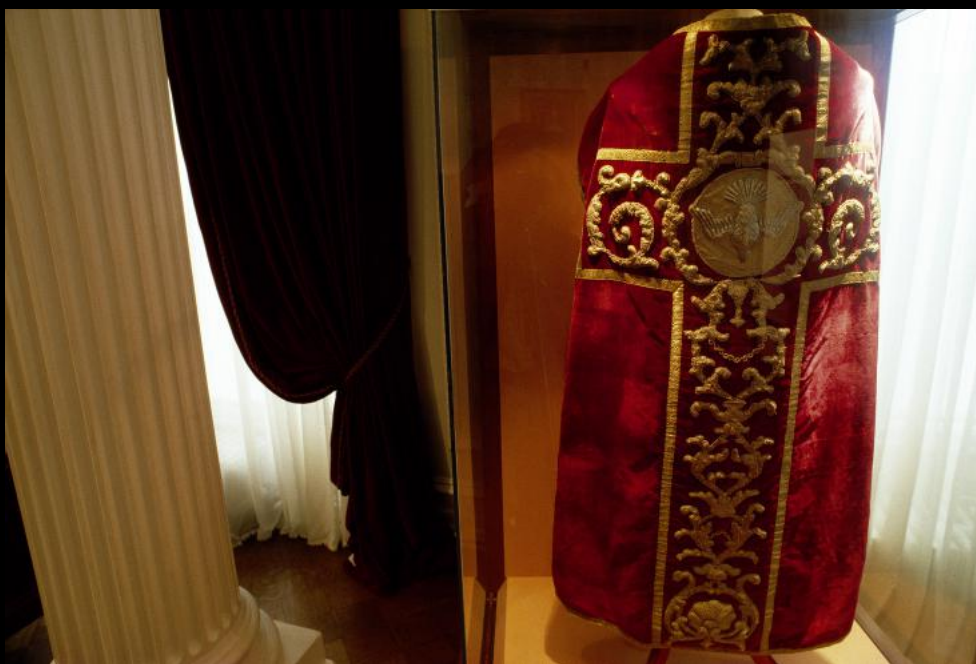
Priester Ornat im Stiftsmuseum von "Kylemore Abbey"