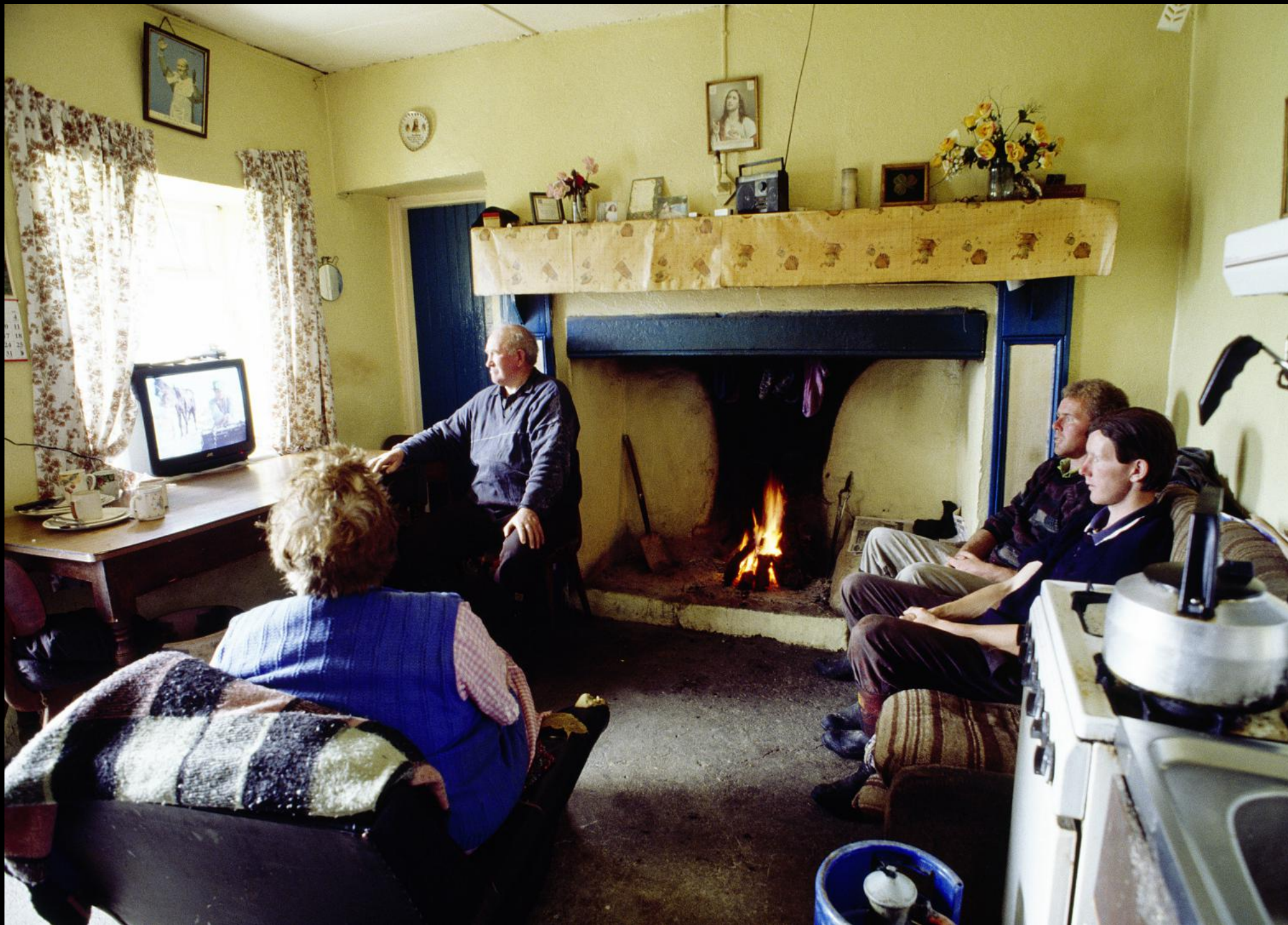
Bauernfamilie in ihrer Wohnküche sieht fern. Der Kamin ist mit Torf befeuert.