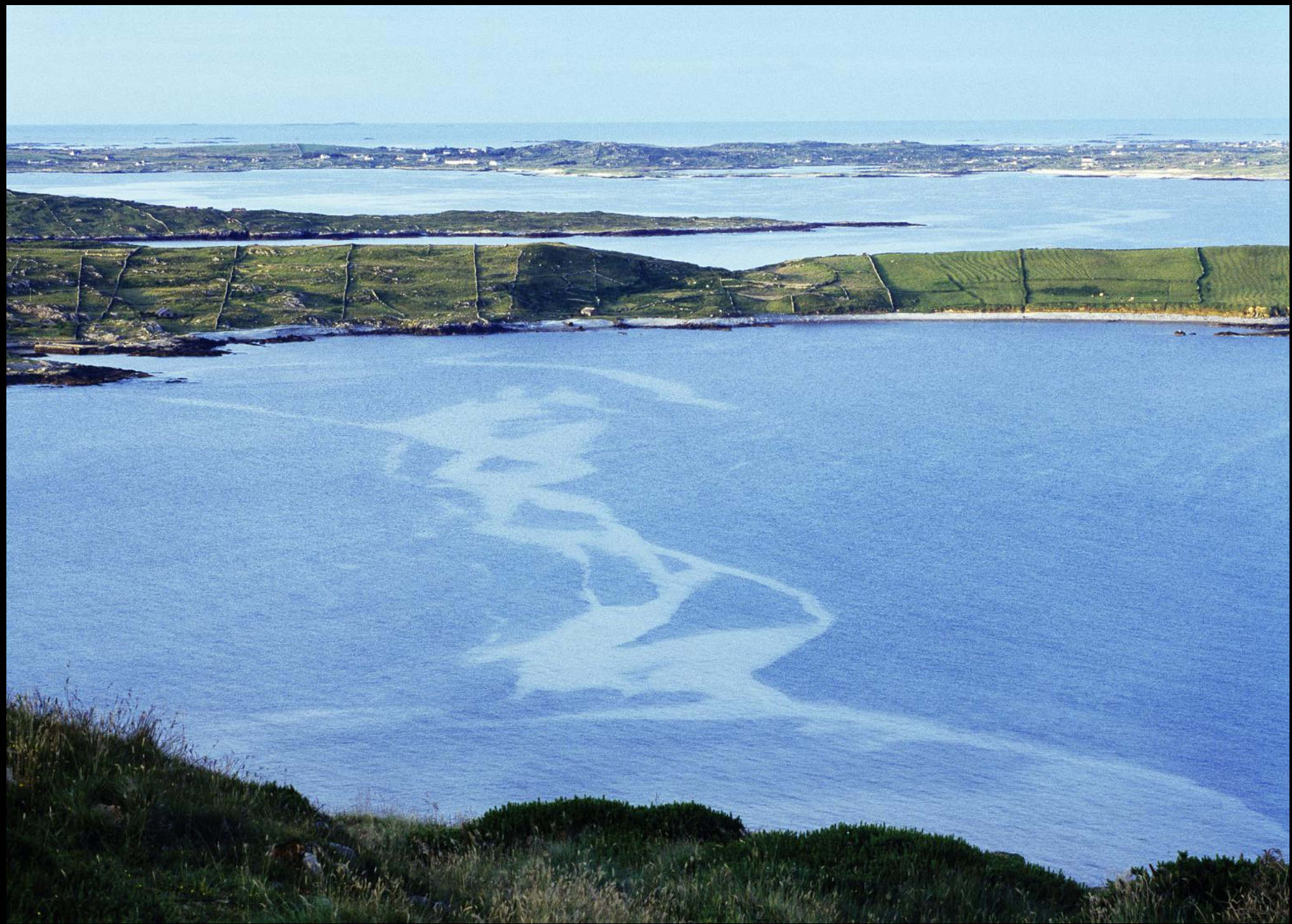
Blick von der Panoramastrasse "Sky Road" zum Atlantik