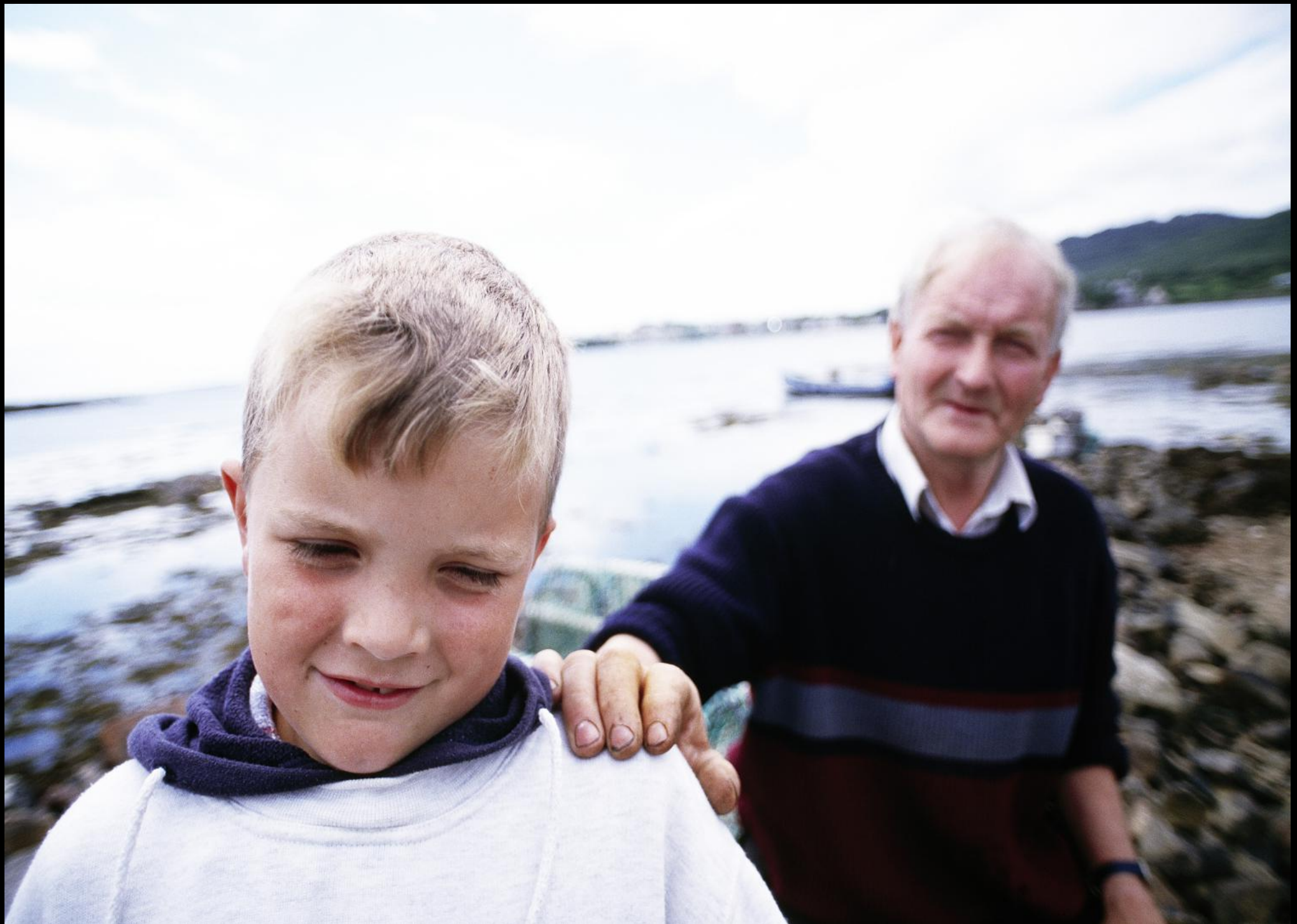
Bub mit Grossvater am Strand