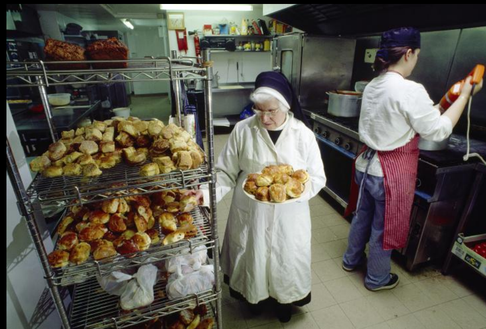
Benediktiner Nonne des Stiftes "Kylemore Abbey" in der Großküche nimmt Gebäck von einem Regal