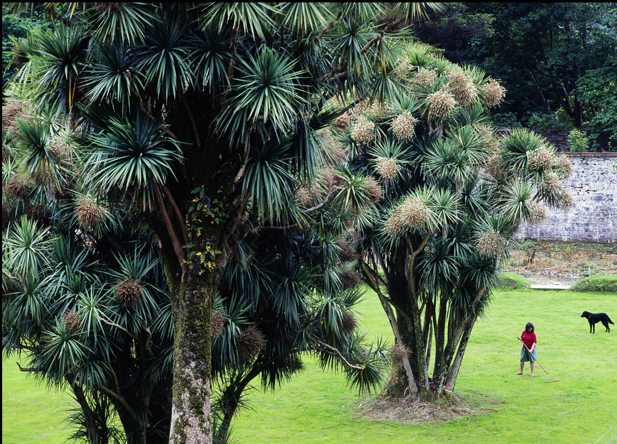
Gärtnerin im Park von "Kylemore Abbey"