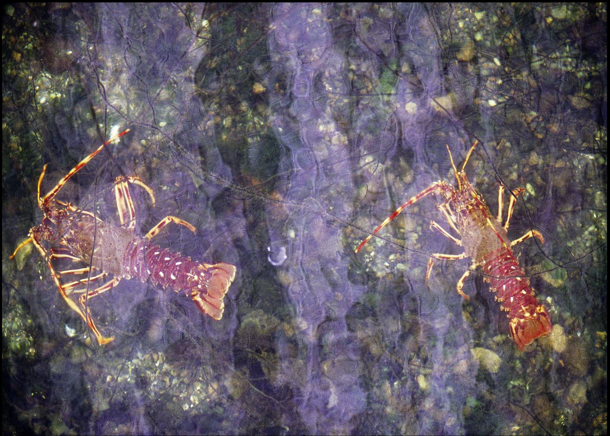
Zwei Hummer im Frischhaltebecken einer Zuchtstation