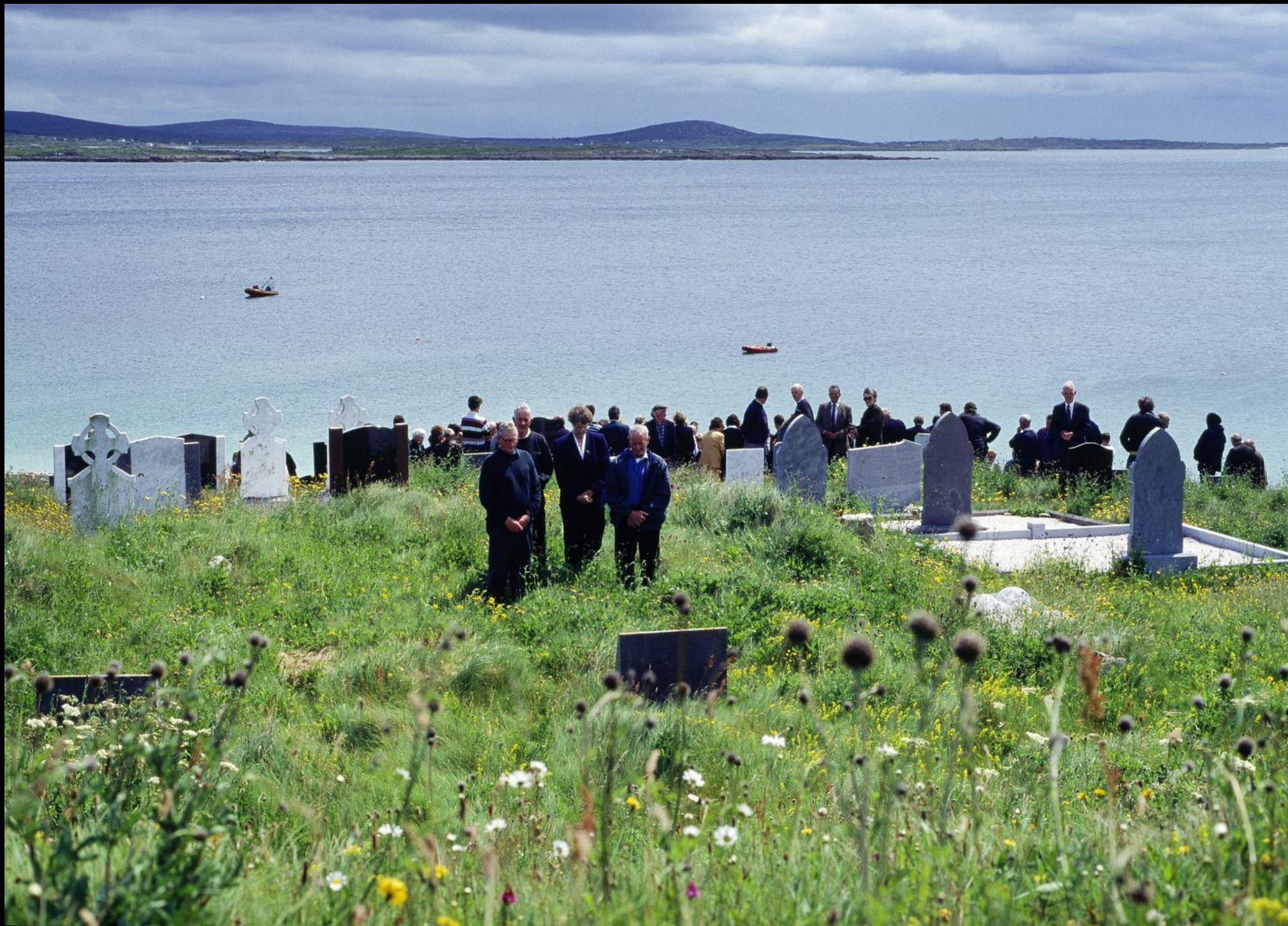
Begräbnis in Roundstone