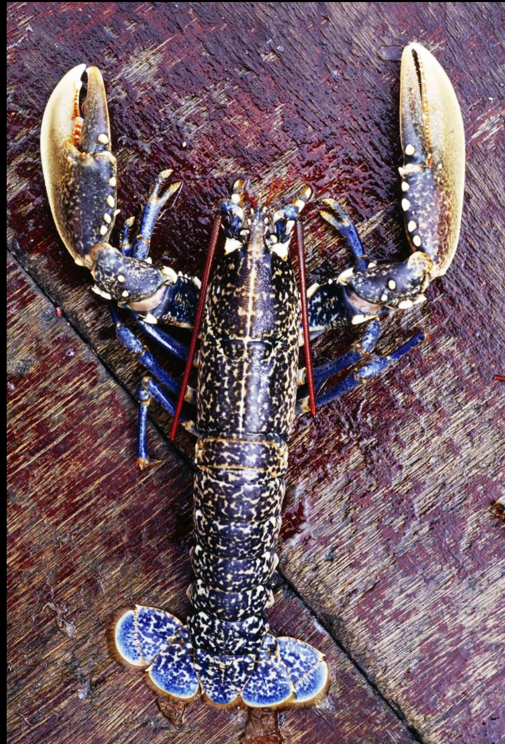
Europäischer Hummer ( Homarus gammarus )