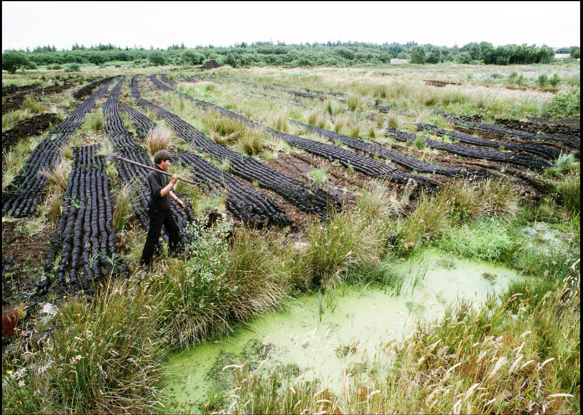
Torfstecher mit Spaten auf dem Weg zur Arbeit