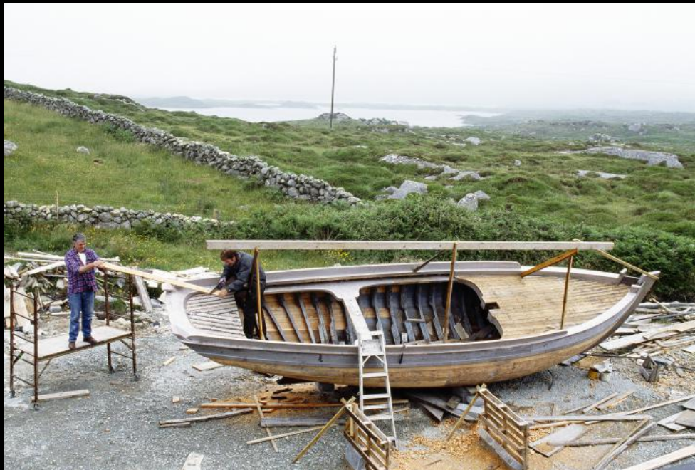
Arbeiter einer kleinen Schiffswerft bei Roundstone