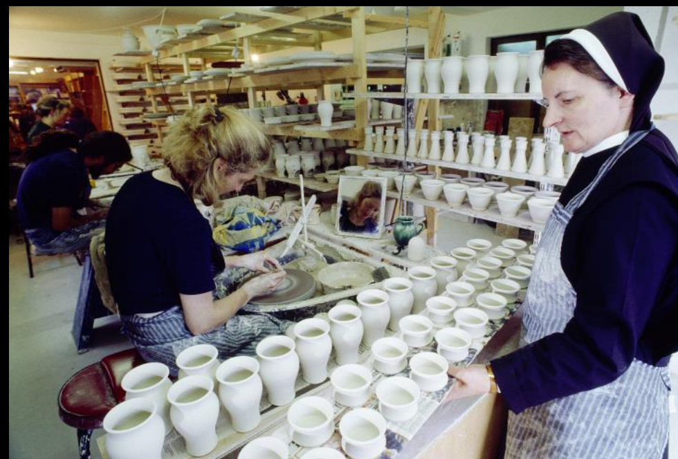
"Kylemore Abbey": Benediktiner Nonne in der Stiftstöpferei