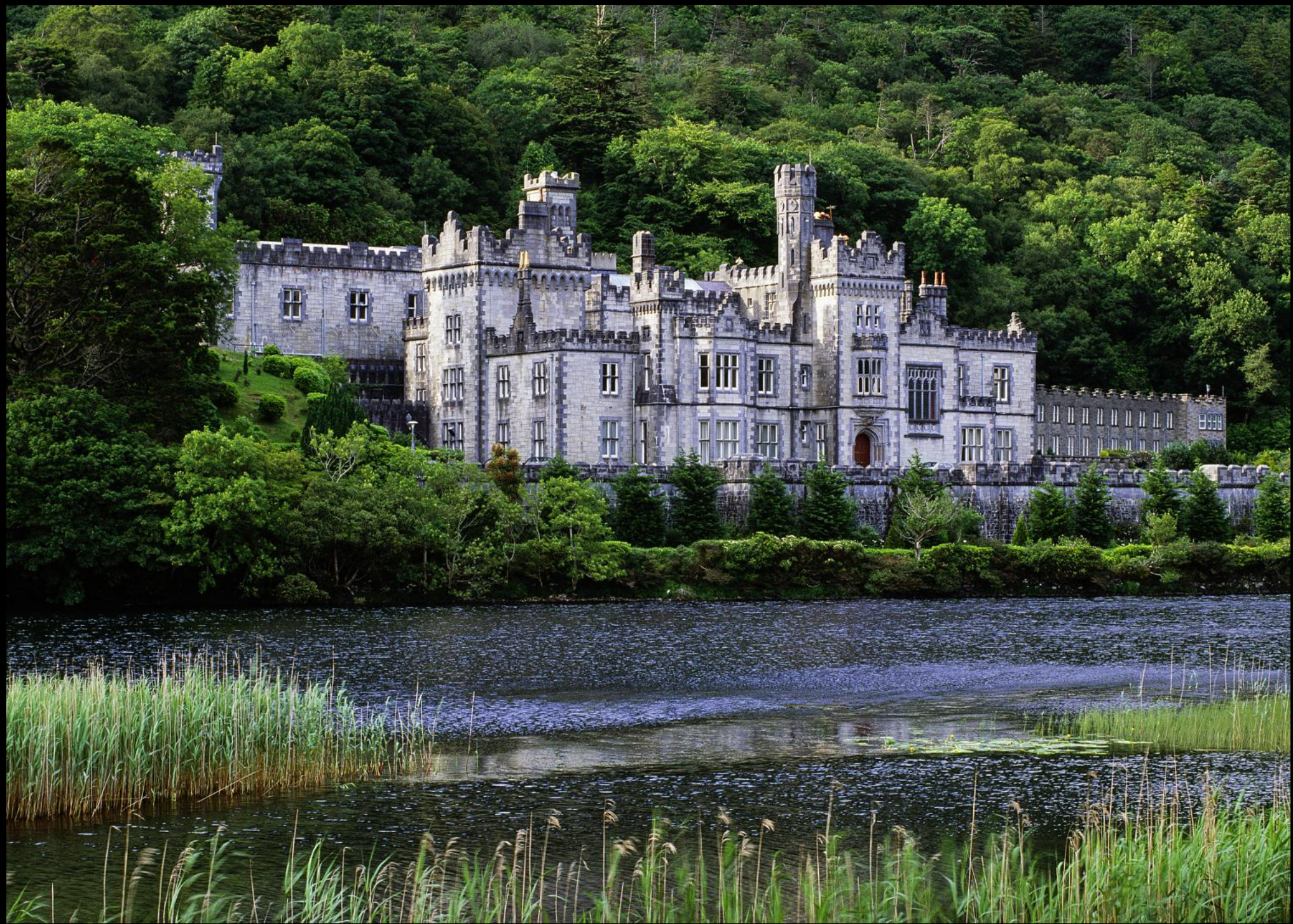
Kylemore Abbey am Lough Pollacappul