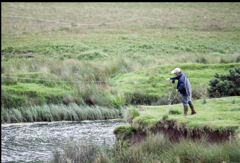
Fliegenfischer wirft seine Angel nach Forellen aus