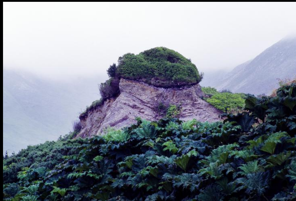
Felsen mit Bewuchs auf der oberen Seite