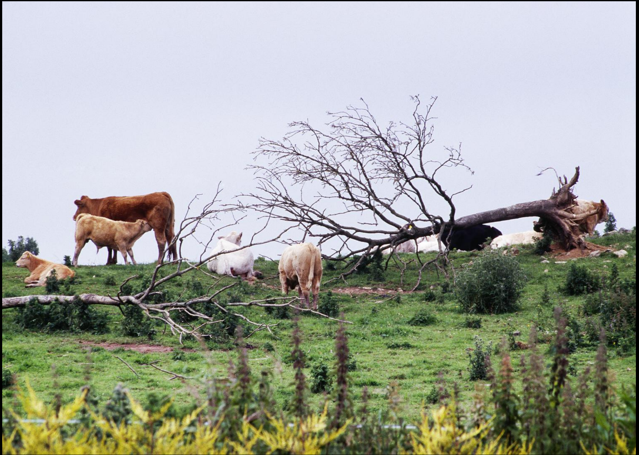
Kühe weiden neben einem umgestürzten Baum.