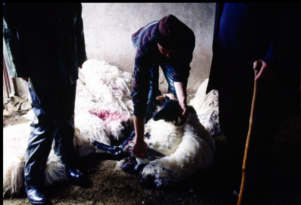
Schaf-Schur mit der Handschere