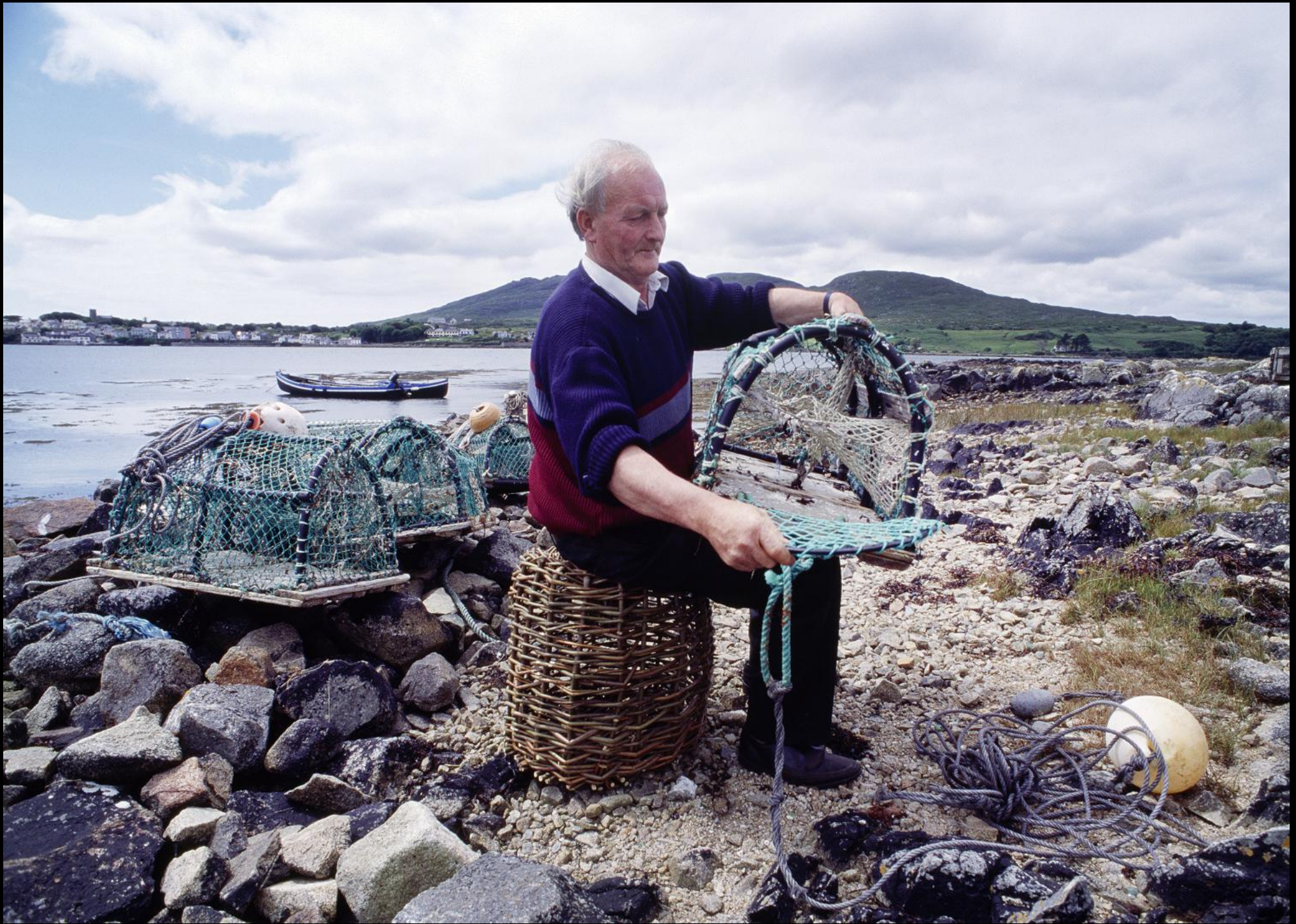
Hummerfischer mit Hummer-Fangkörben am Strand