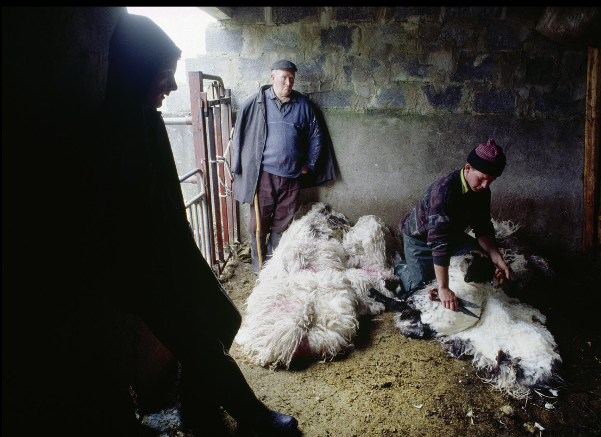
Bauern in ihrem Stall bei der Schafschur