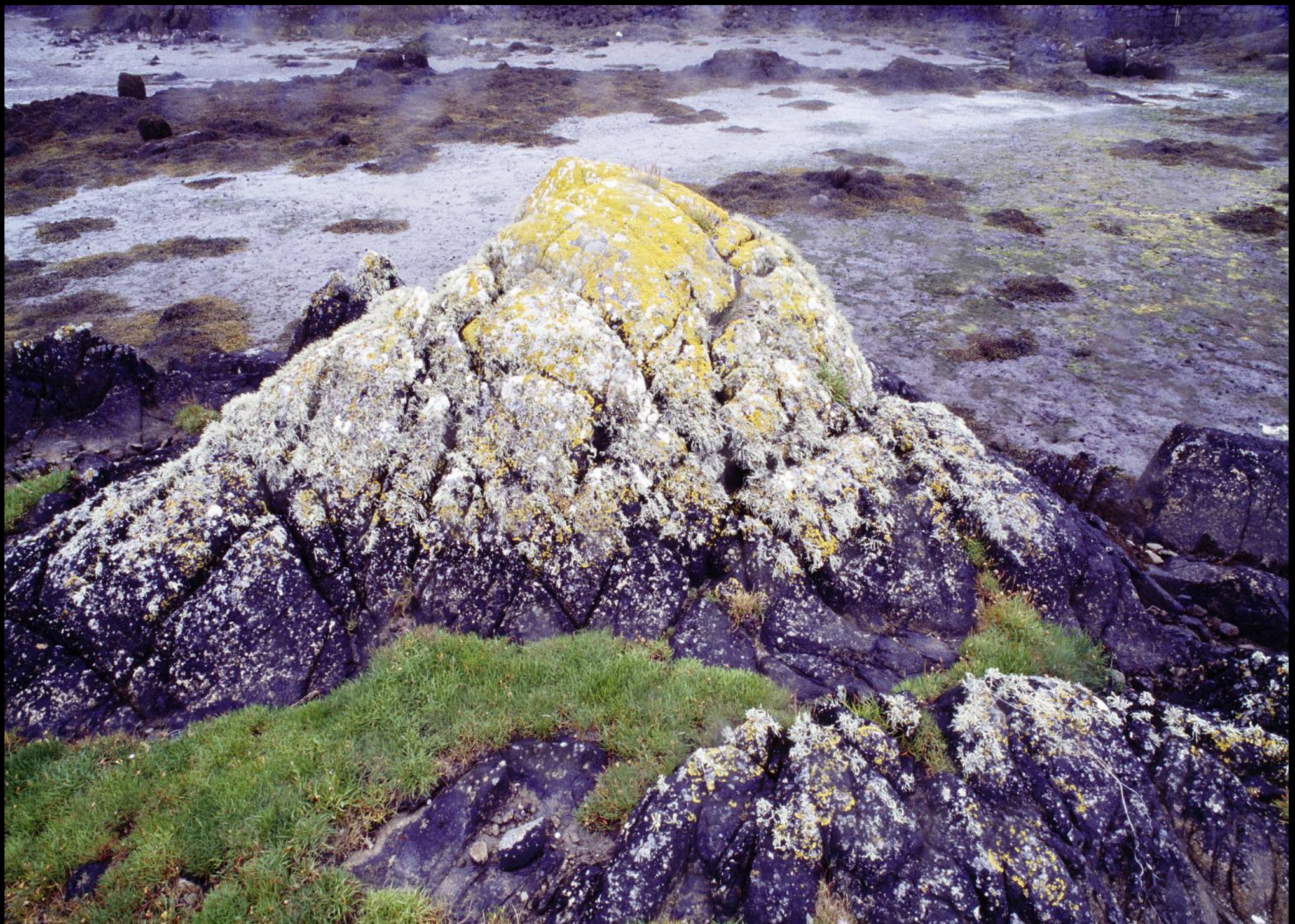
Flechten auf einem Felsen