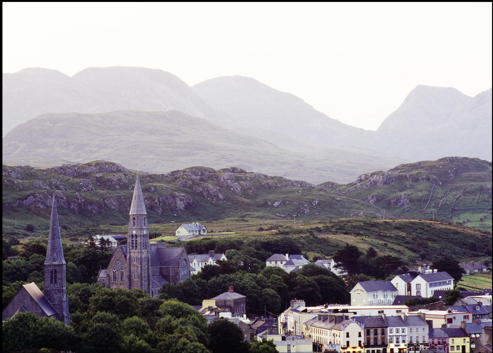
Clifden ist die inoffizielle Hauptstadt von Connemara und hat 2700 Einwohner.