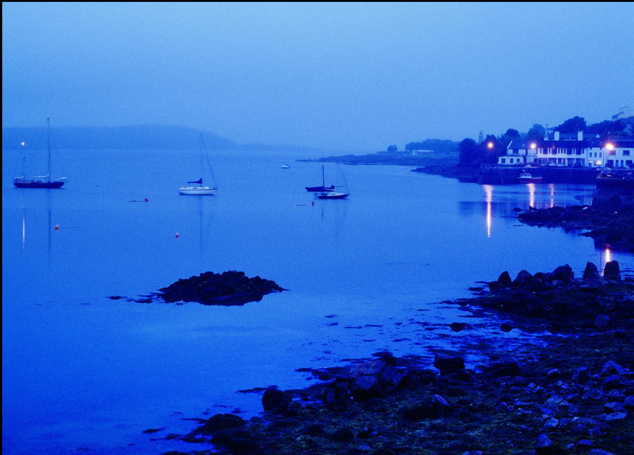
Bucht bei Roundstone