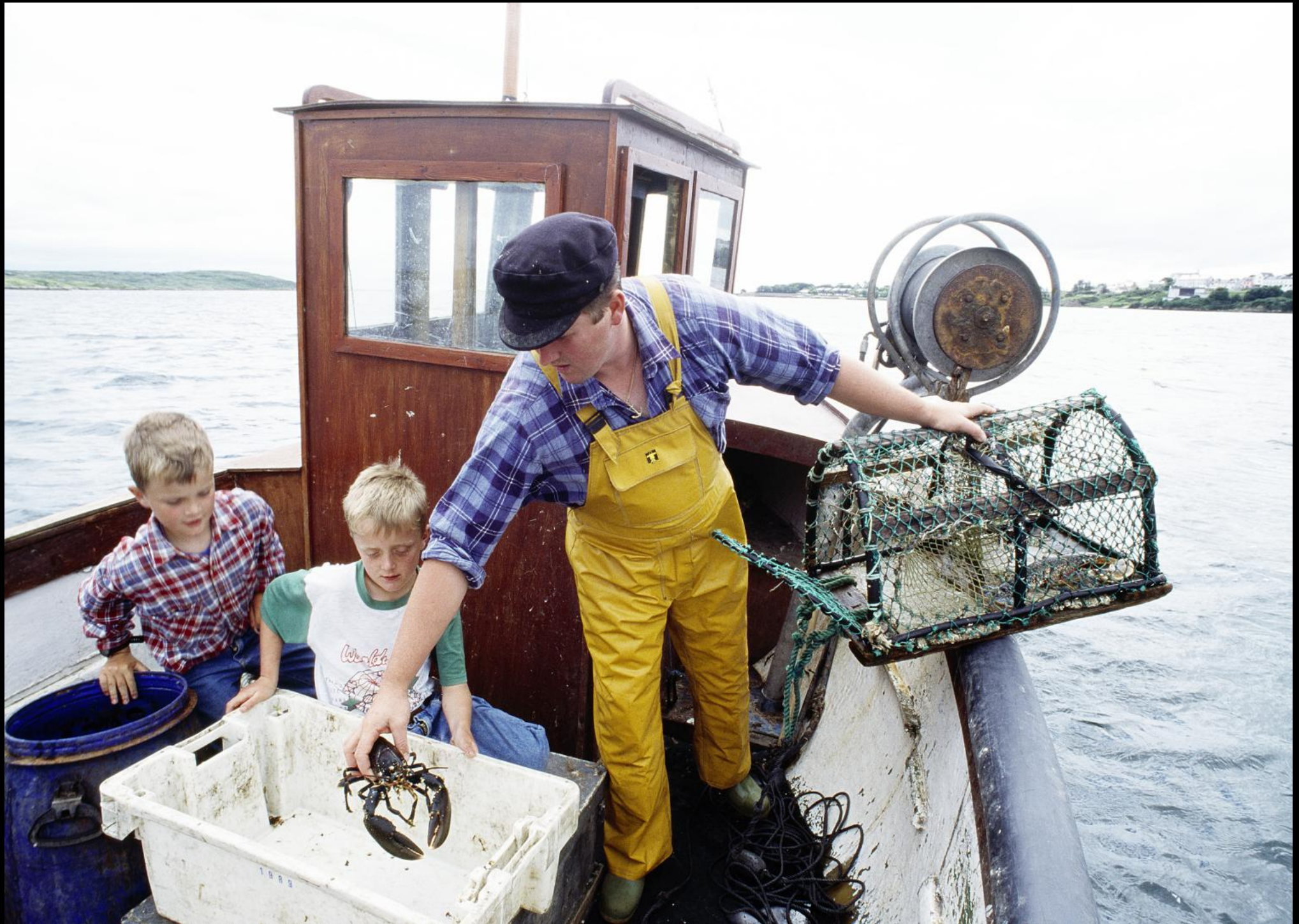
Hummerfischer mit seinen Söhnen bei der Arbeit