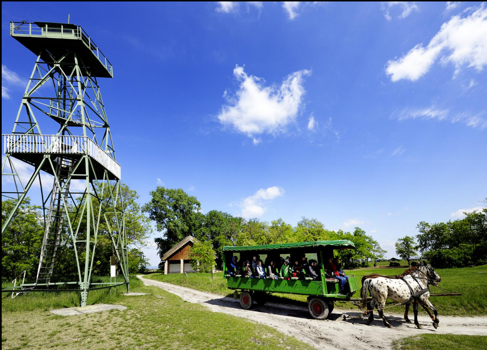
Grenz-Wachturm aus der Zeit des Eisernen Vorhanges