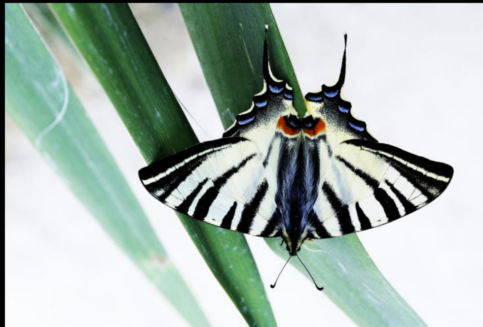
Segelfalter sitzt auf Schwertlilie