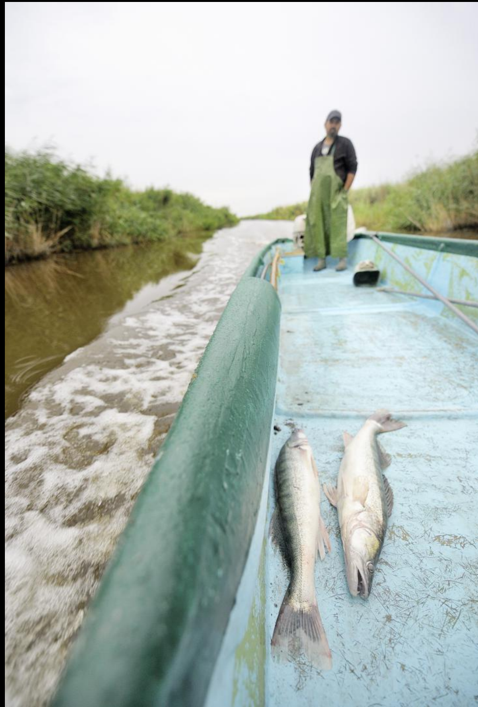
Fischer in einem Schilfkanal mit Zandern