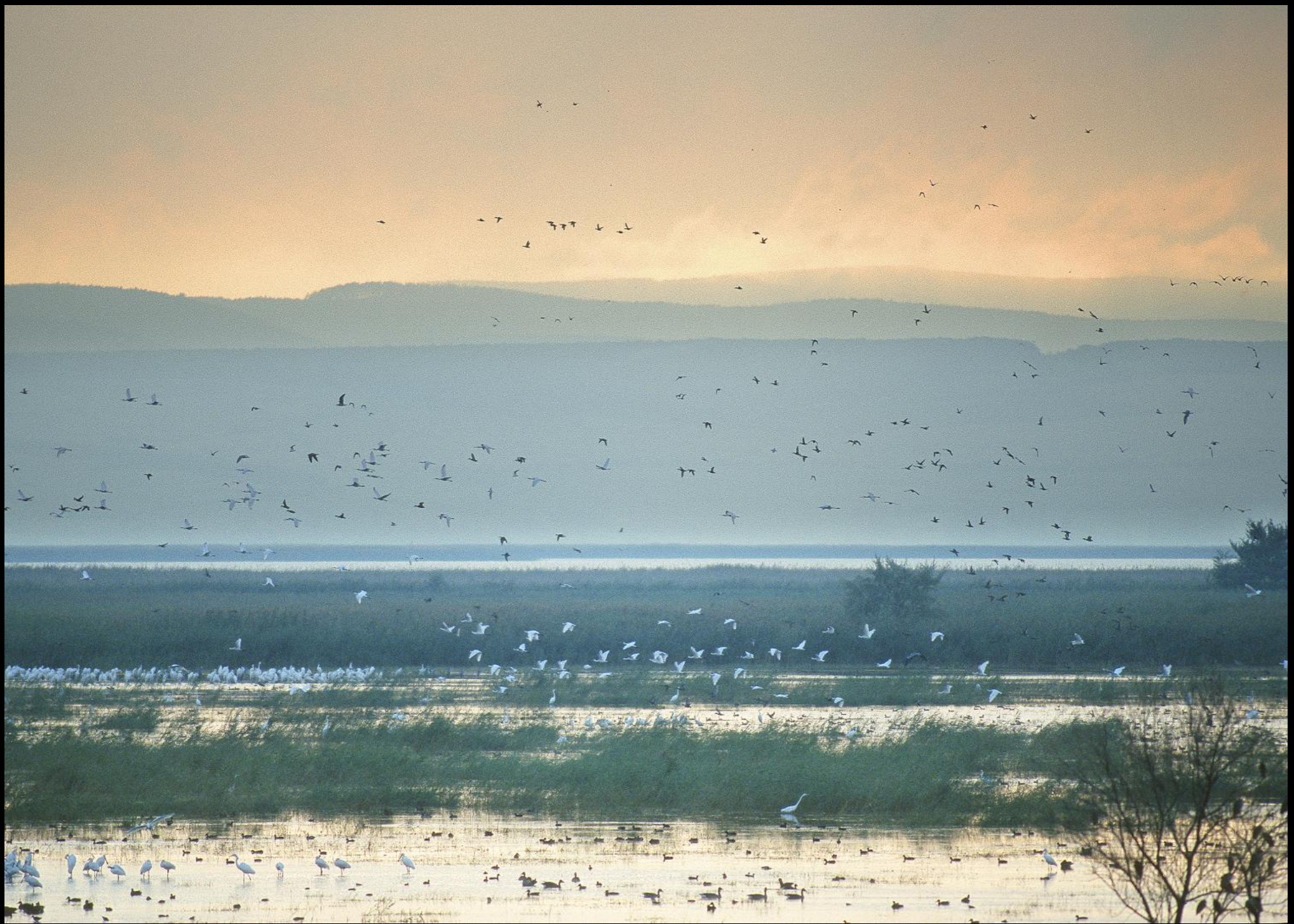
Reiher und Leithagebirge