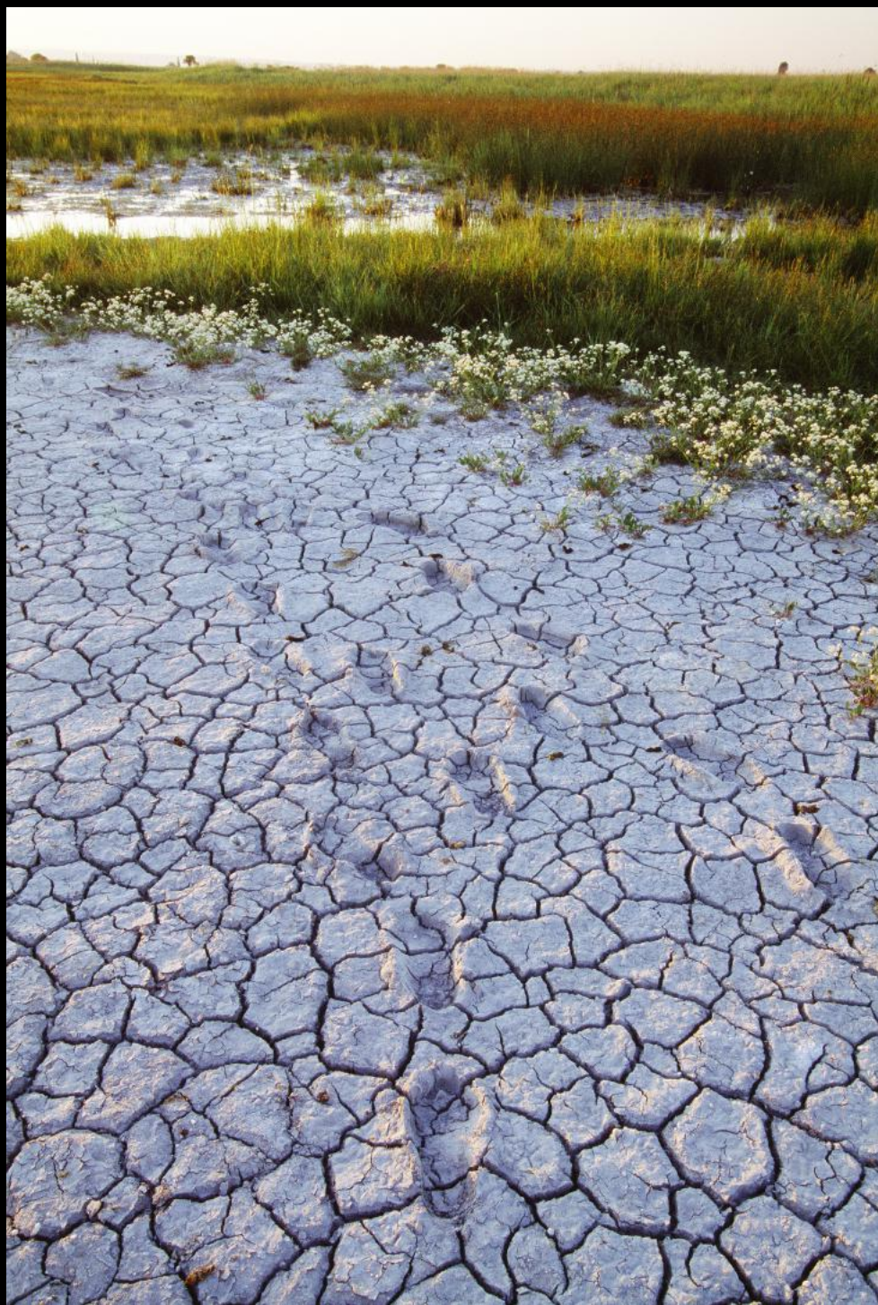
Lange Lacke: aufgerissener Soda-Boden