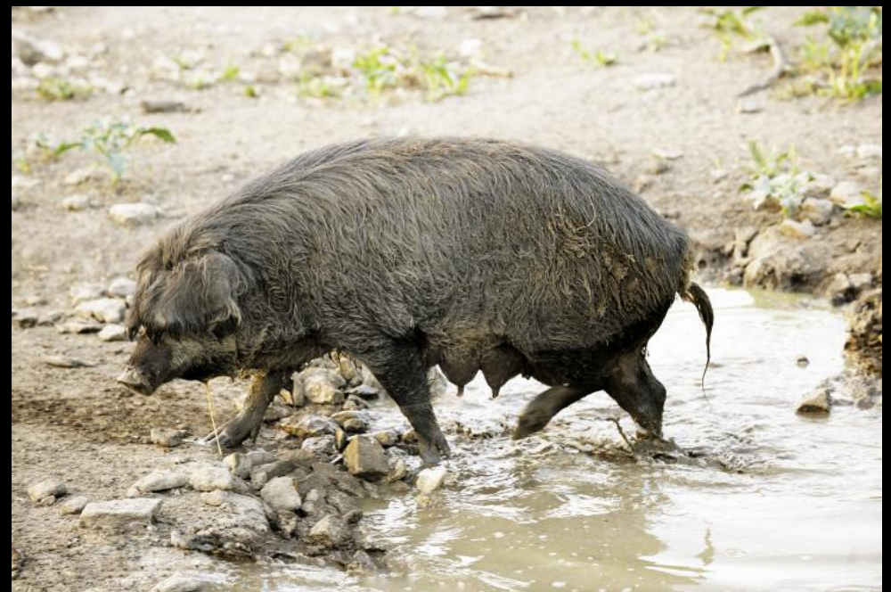
Wollschwein (Mangalitza) auf der Weide