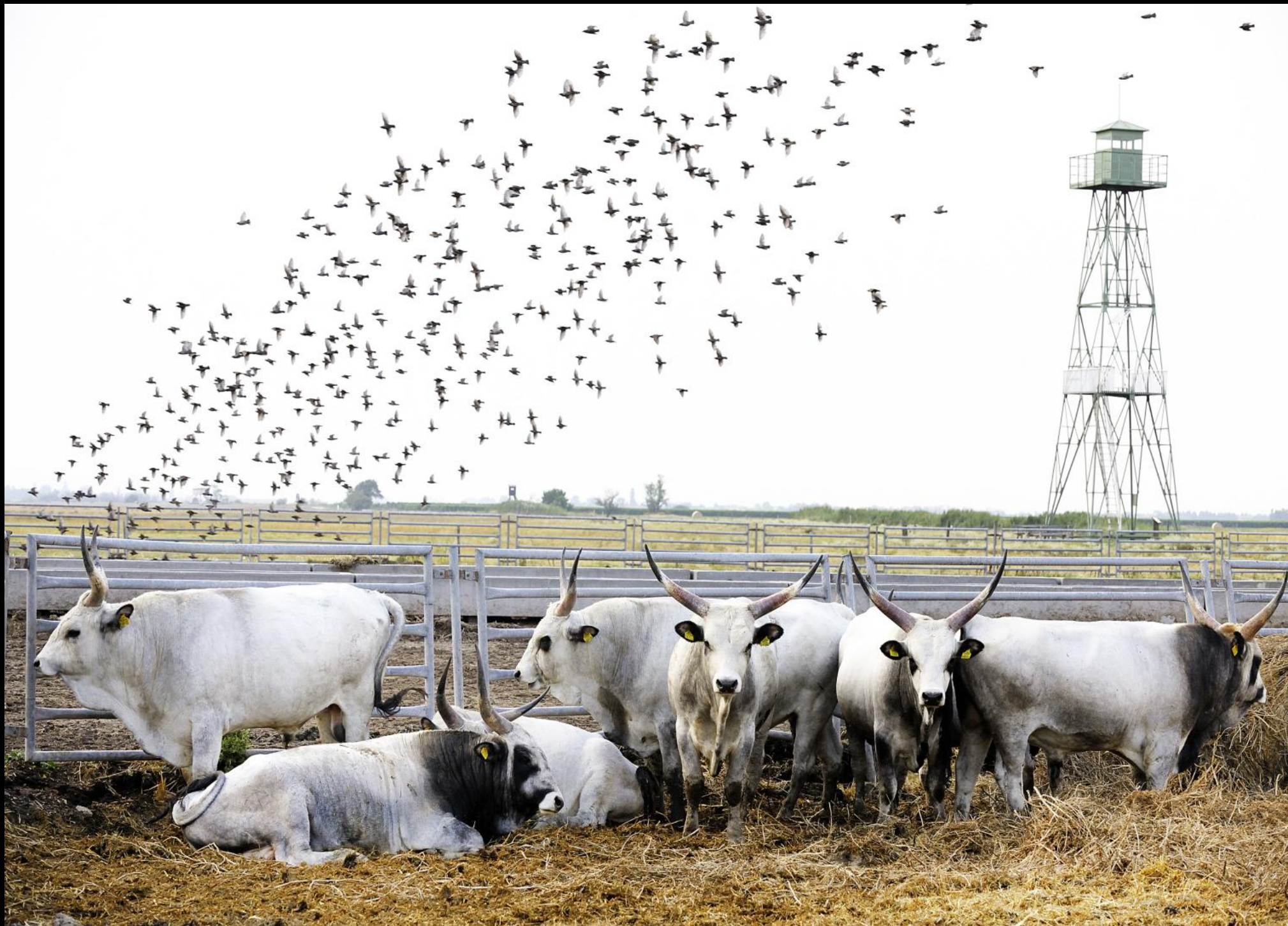
Ungarische Graurinder und Stare beim Grenz-Wachturm im Nationalpark Neusiedlersee-Seewinkel bei Illmitz