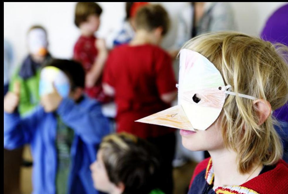
Schulklasse bastelt Vogelmasken