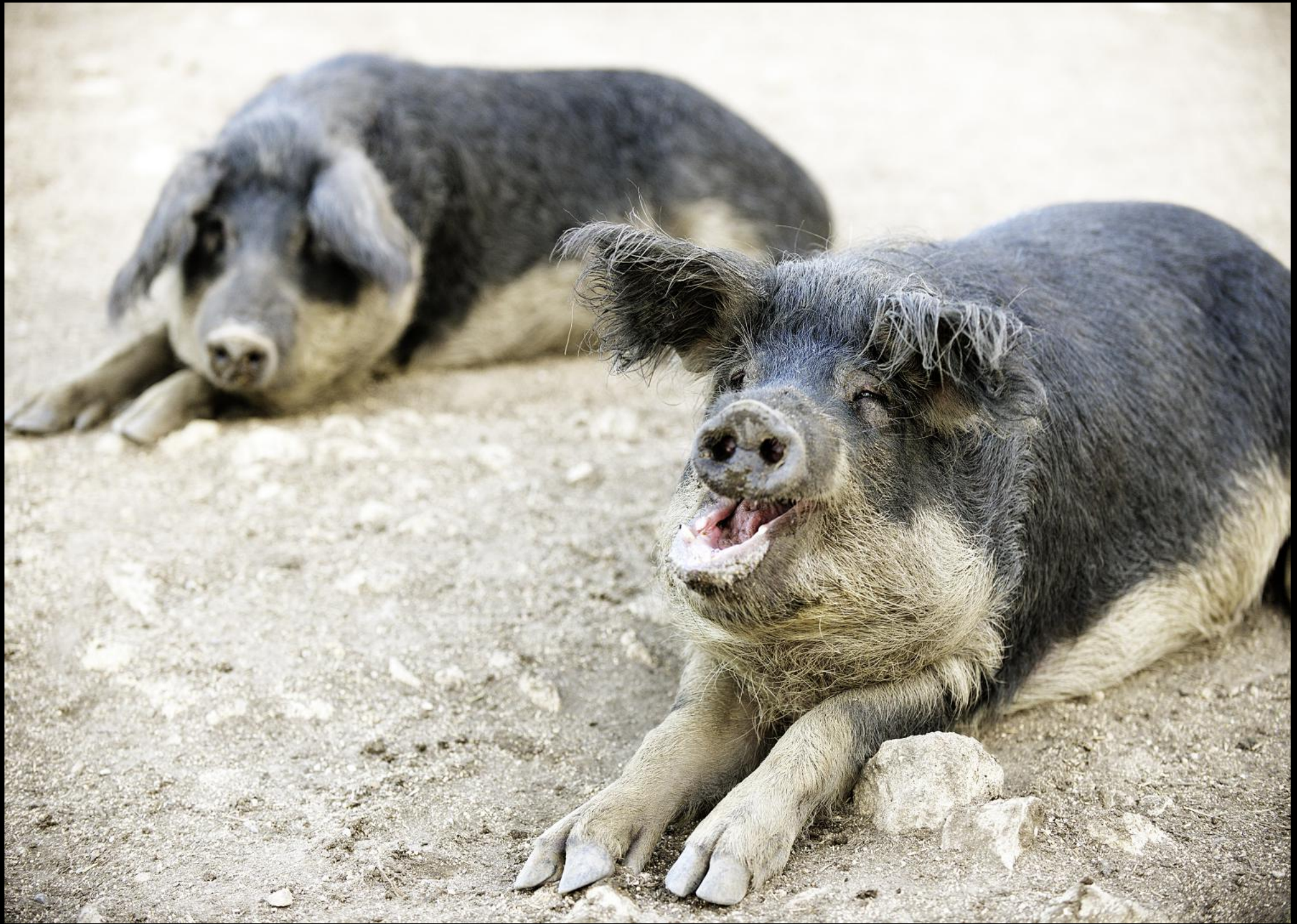
Wollschweine (Mangalitzas) auf der Weide