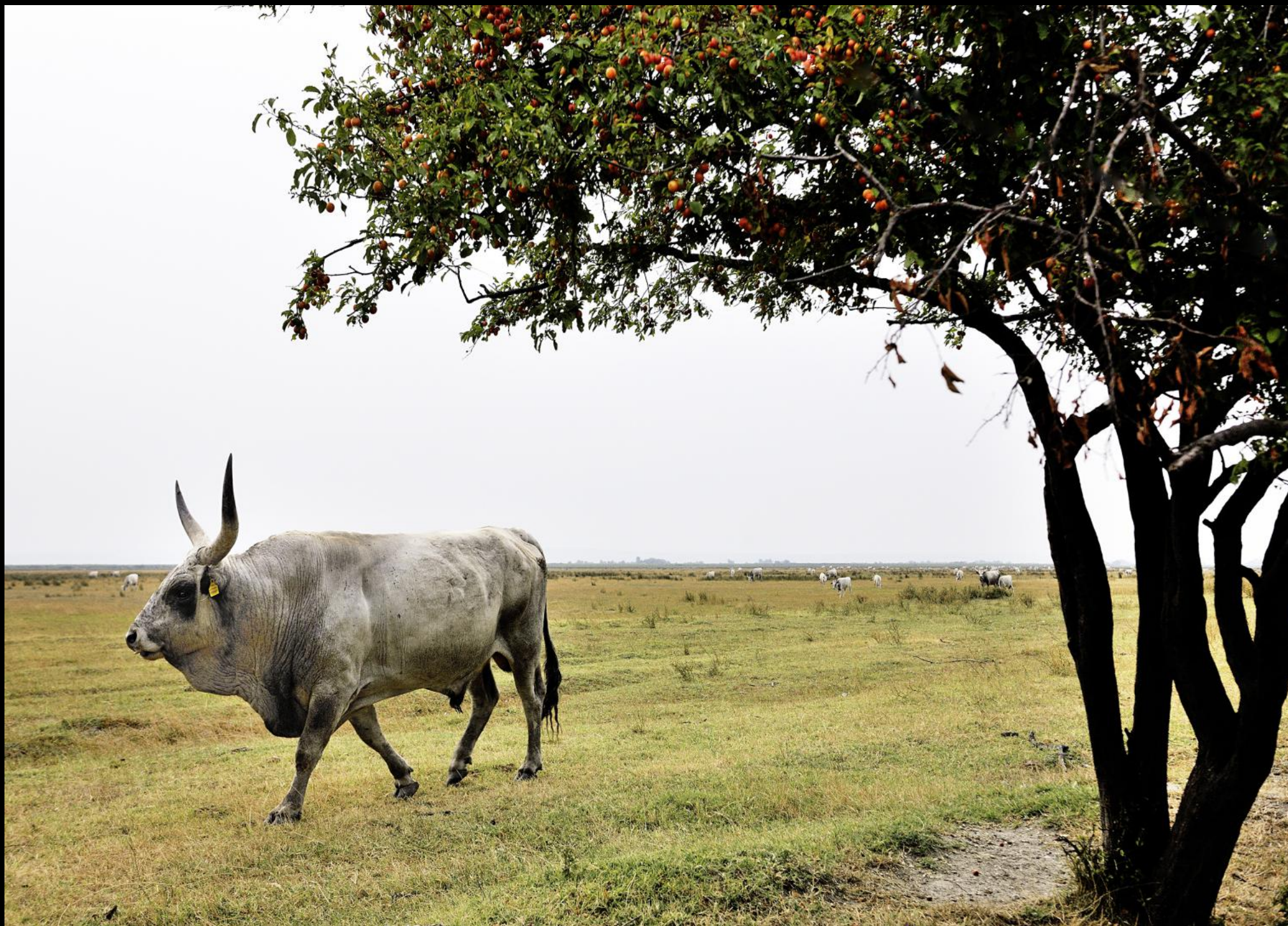
Ungarische Graurinder auf der Weide des Nationalparks