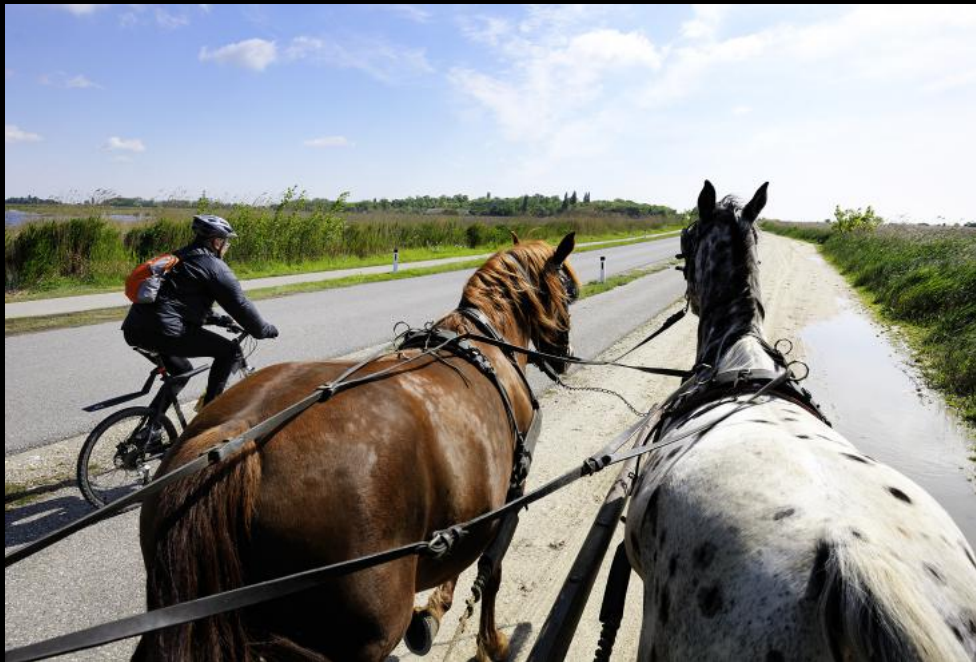
Kutschenfahrt nach Illmitz