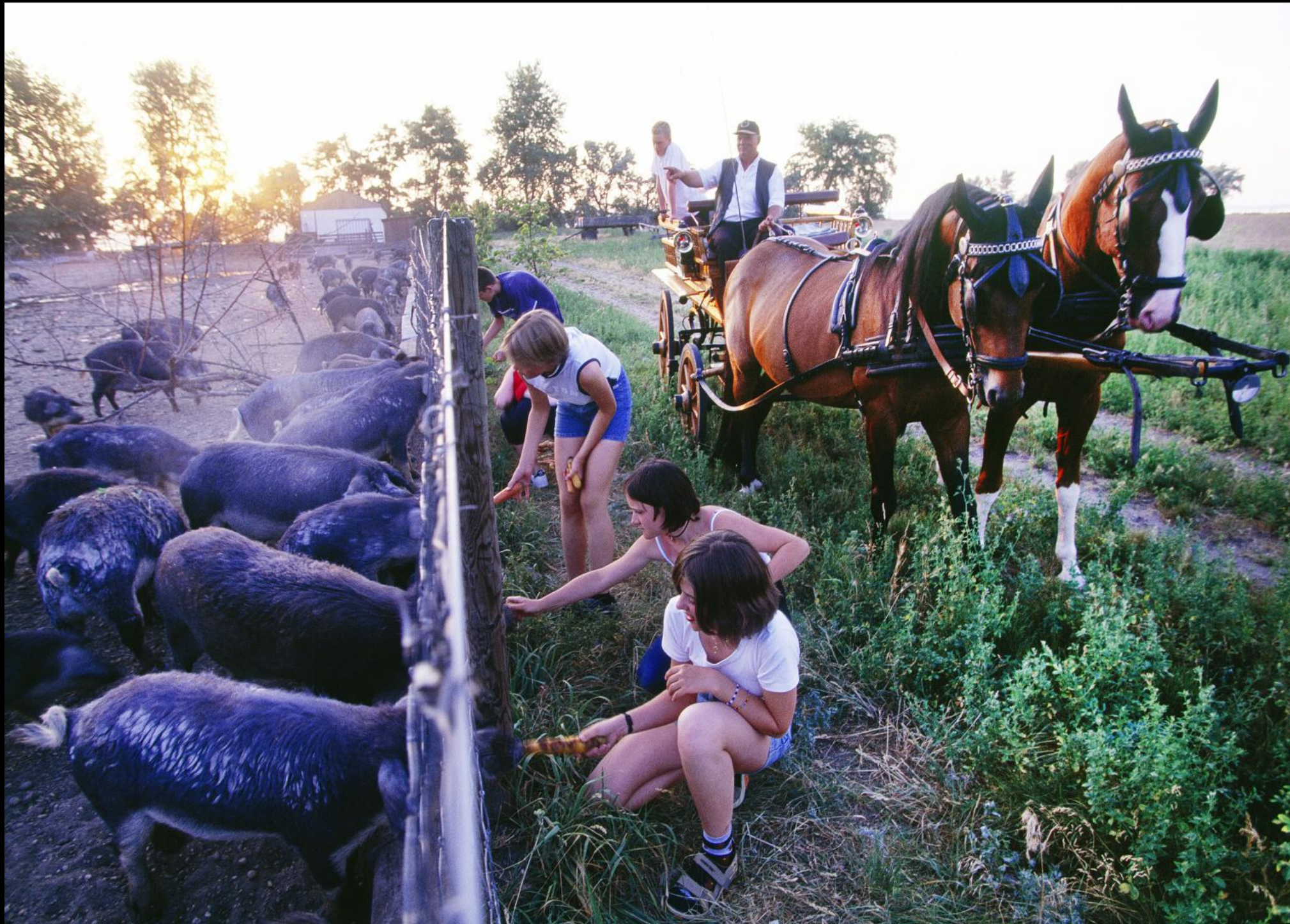
Wollschweine (Mangalitzas) in der "Podersdorfer Hölle"