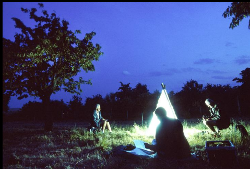
Schmetterlingsforscher zählen Nachtfalter