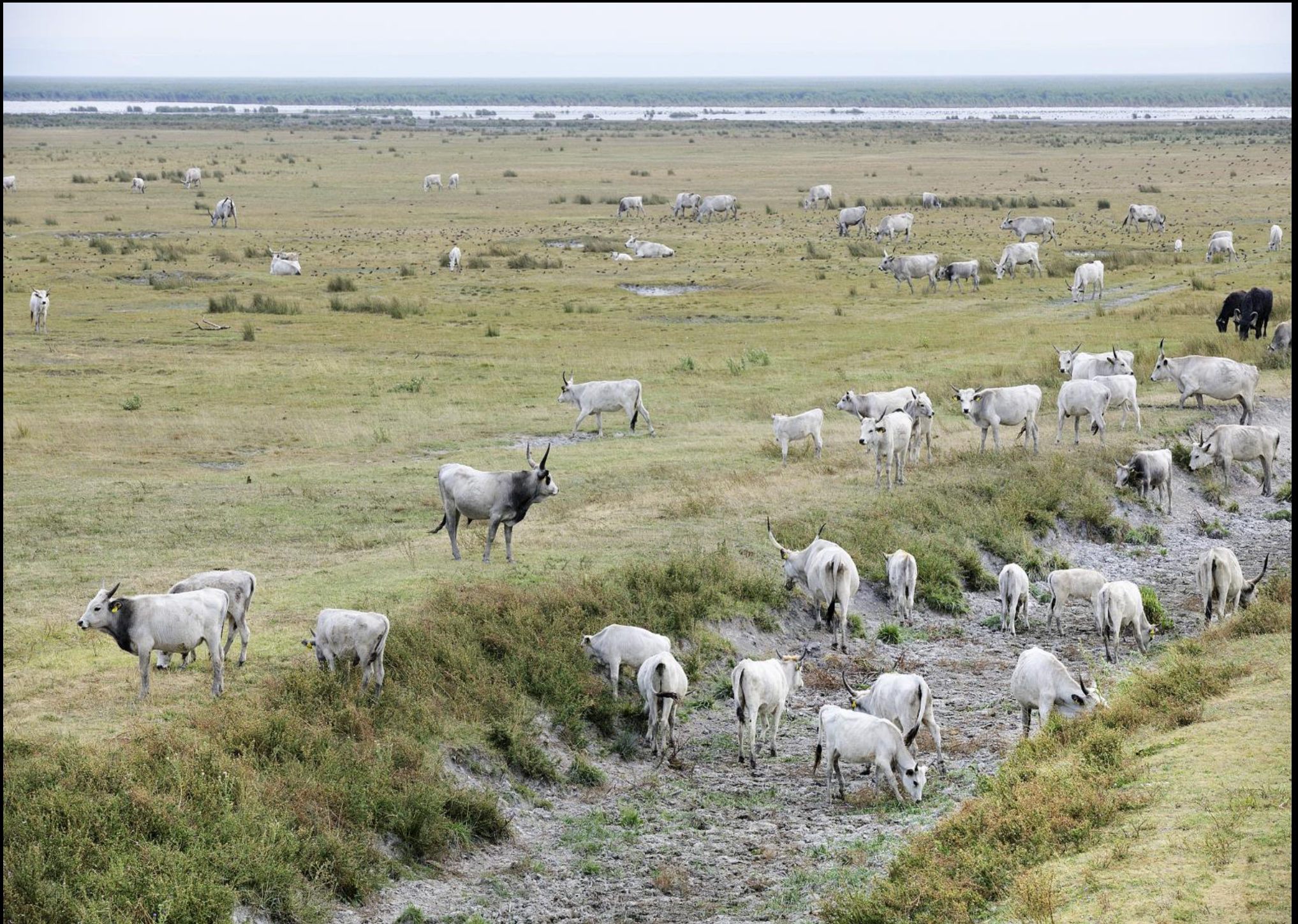
Ungarische Graurinder auf der Weide des Nationalparks