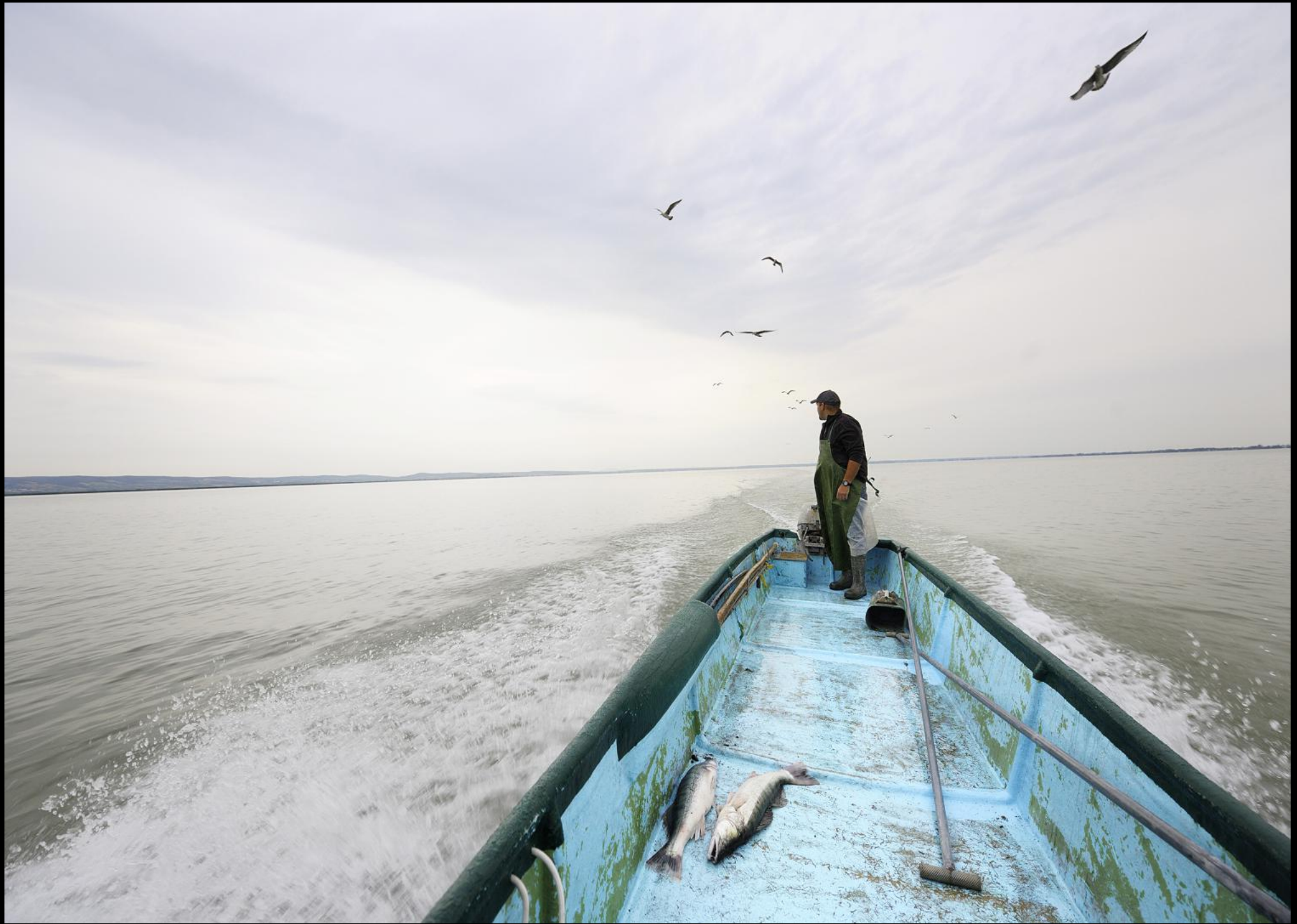
Fischer mit Zandern