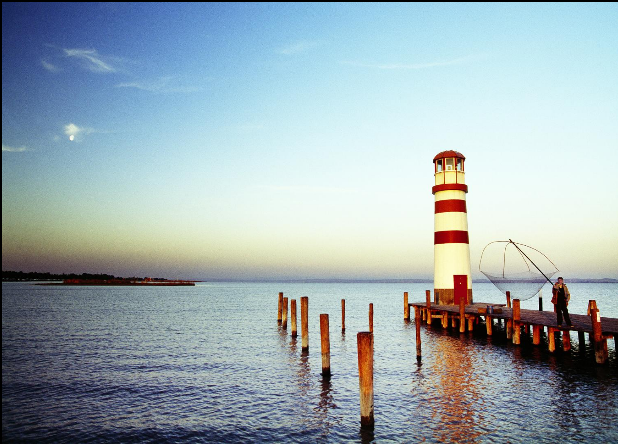
Leuchtturm von Podersdorf und Fischer