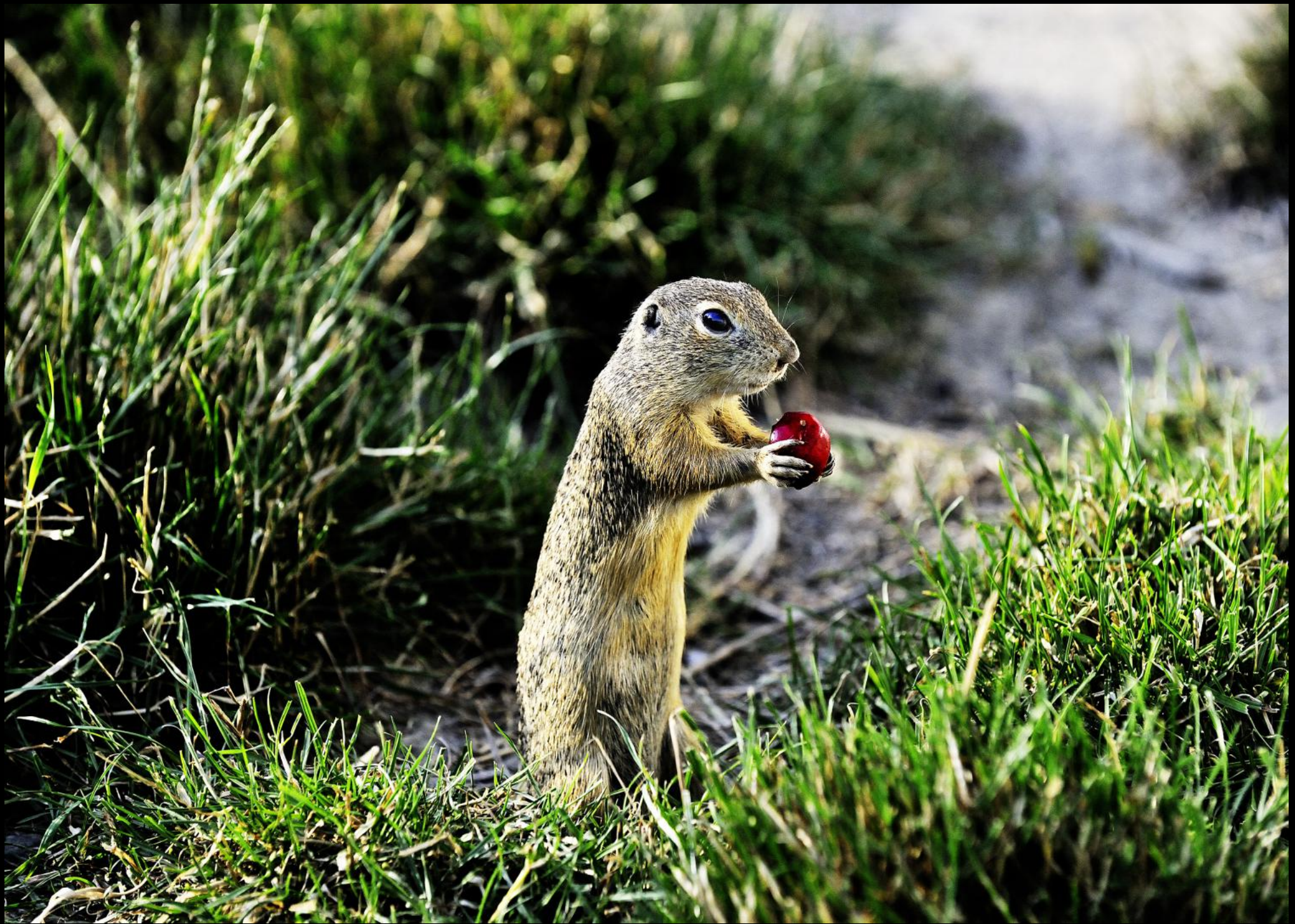
Ziesel ( Spermophilus citellus ) mit Kirsche