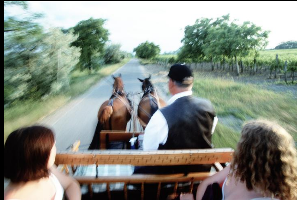
Kutschenfahrt durch die "Podersdorfer Hölle"