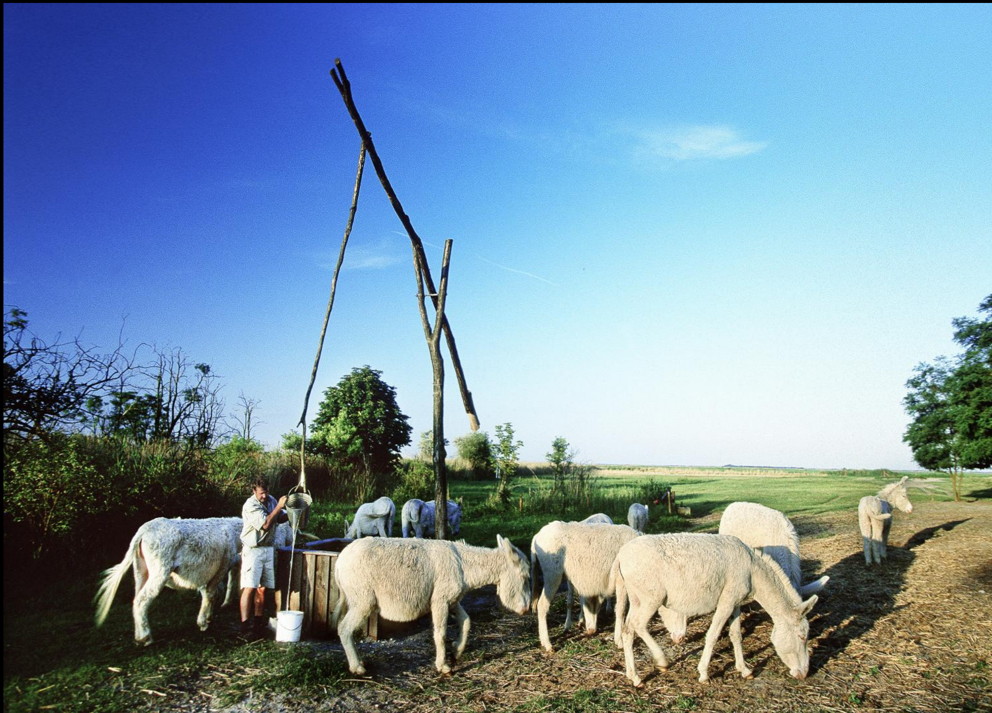
Weisse Esel und Nationalparkwächter beim Ziehbrunnen von Illmitz