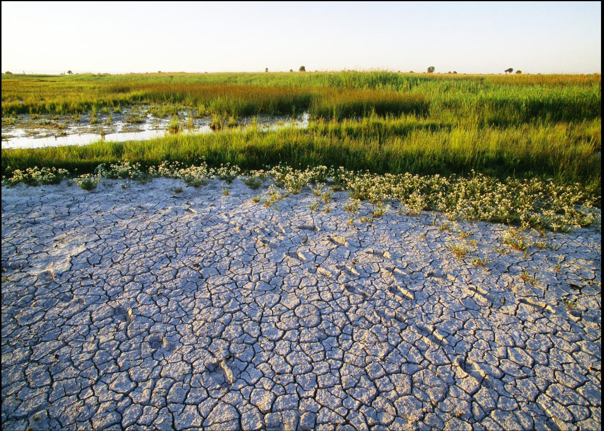
Lange Lacke: aufgerissener Soda-Boden