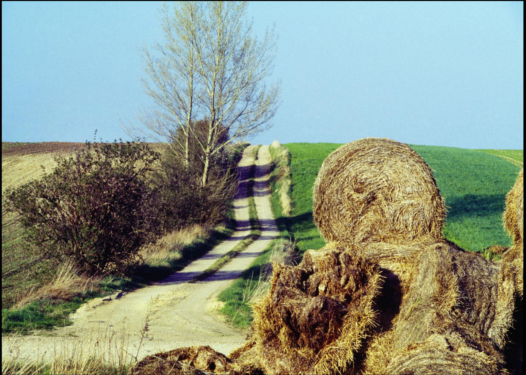
Feldweg und Strohriste