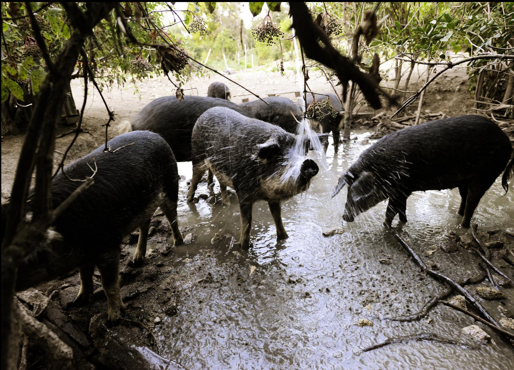
Wollschweine (Mangalitzas) auf der Weide