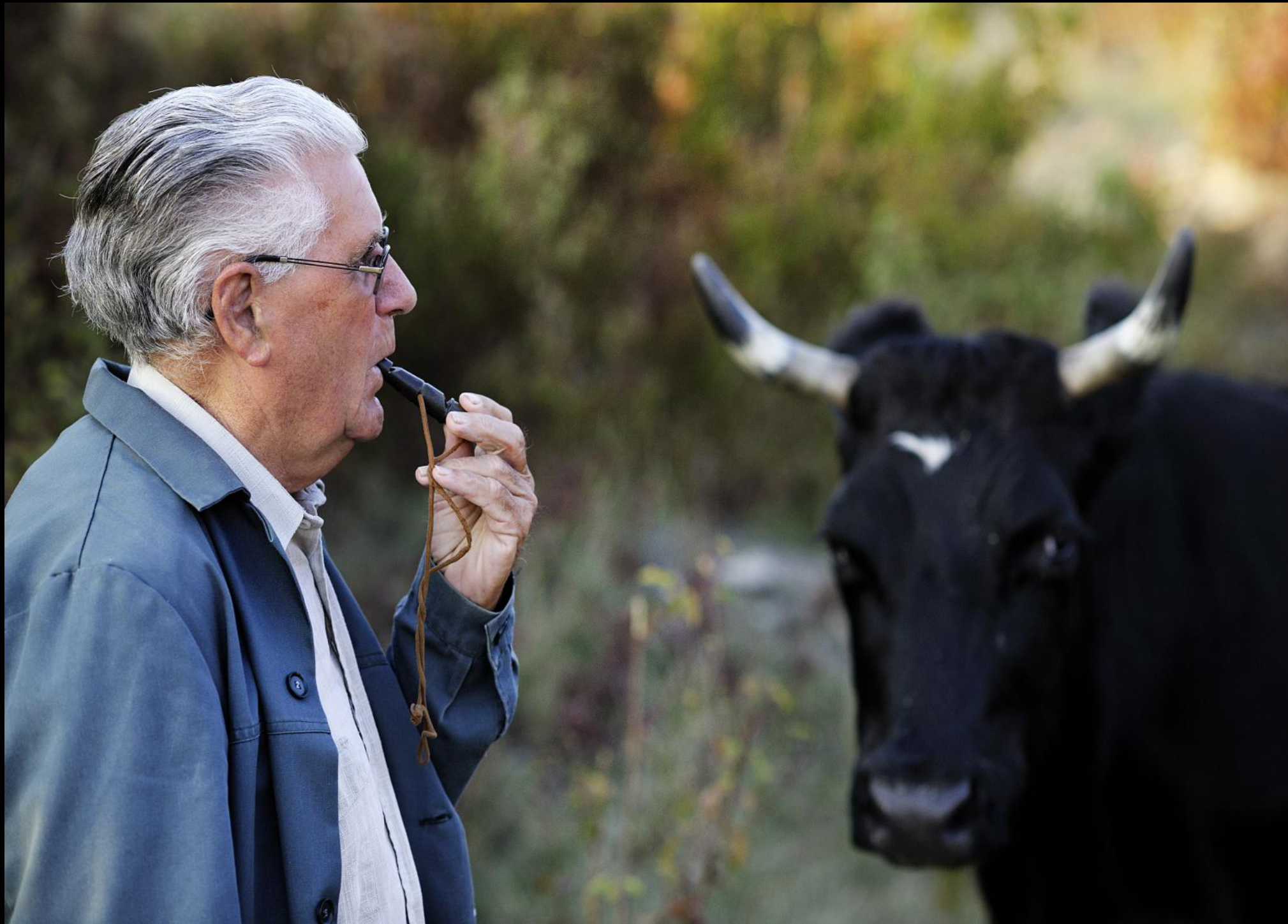
Hirte mit Signalpfeife